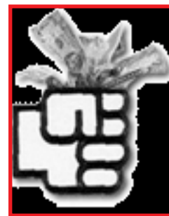
Todo por la pasta